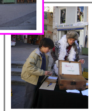
Les crieurs publics